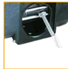
EINLAUFSPERRE MIT DÄMPFUNGSFEDER